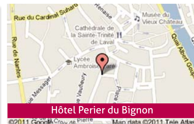
Hôtel Perier du Bignon